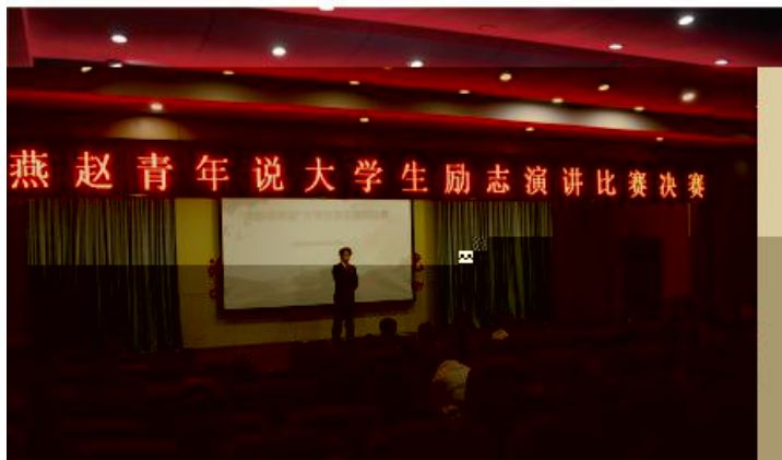
燕赵青年说大学生励志演讲比赛决赛