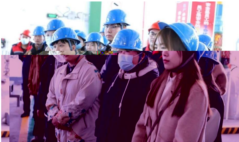
到企业 位 习

“借，为。”“” ，“”以，企严单协 ，共人养，利 人养任务，个中单全体优 ，专业、上佳。到业之， 北化公厚， 公企，企业产一位 习，习中们公个位，一 升了业力，为了北 化公中。