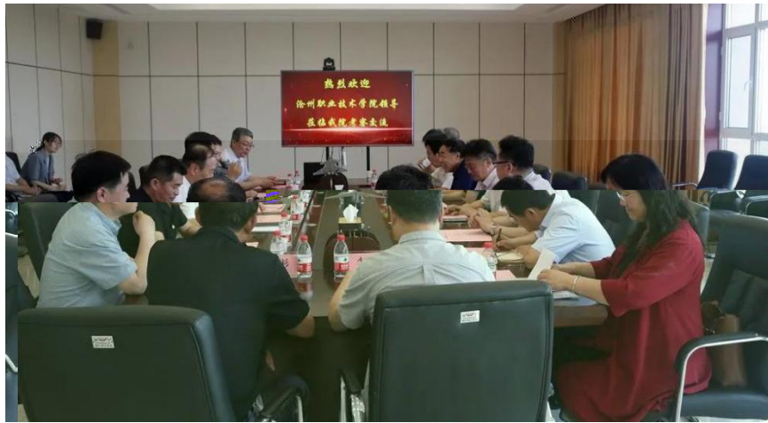
企 单 养 交